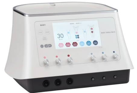
業務用EMS美容器 ボディセラプロII