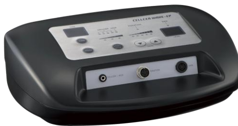
複合フェイシャル機器 セルサーウェブ-EP